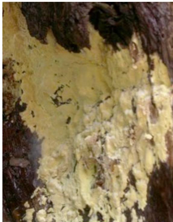
・大枝の樹皮に付着した背着生子実体