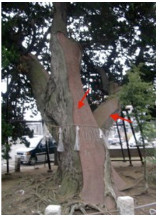
・根元から幹・大枝にかけての治療痕